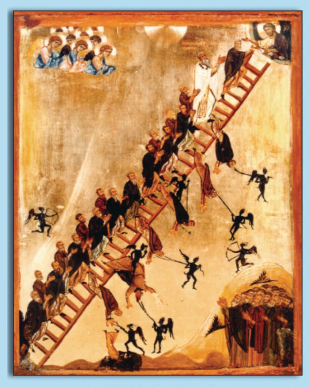
Icon of the the Ladder of Divine Ascent

1724 Avenue P Brooklyn, New York 11229-1206Tel: (718) – 339- 0280Web site:www.threehierarchsbrooklynny.orgE-mail : info@threehierarchsbrooklyn.org