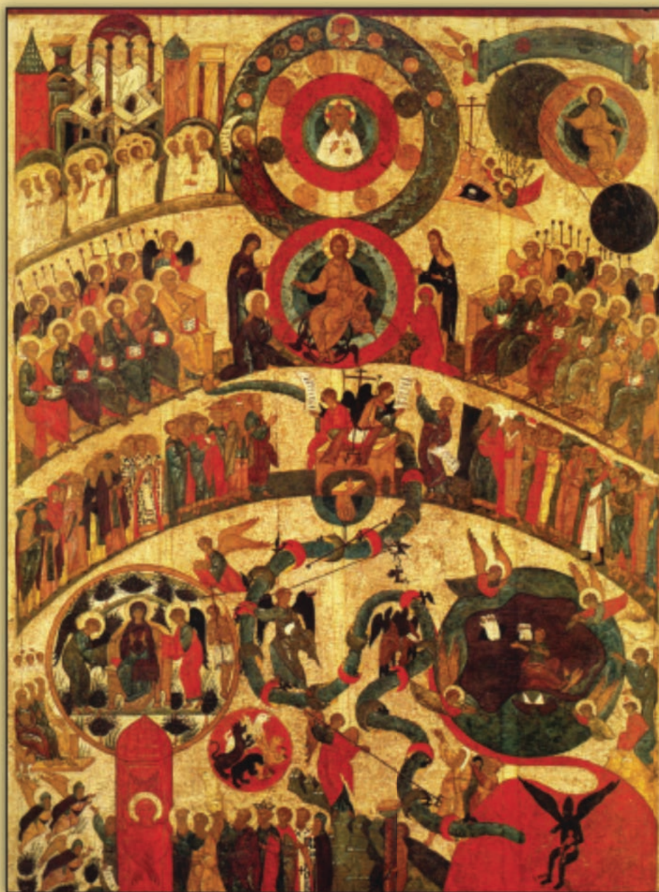
Icon of the Last Judgment

1724 Avenue P Brooklyn, New York 11229-1206 Tel: (718) – 339- 0280