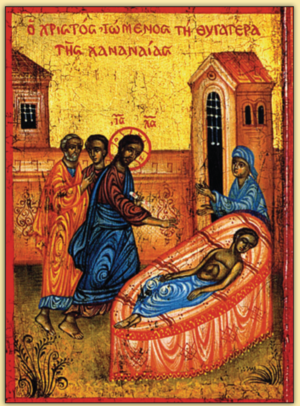
Icon of the Canaanite Woman

1724 Avenue P Brooklyn, New York 11229-1206 Tel: (718) – 339- 0280