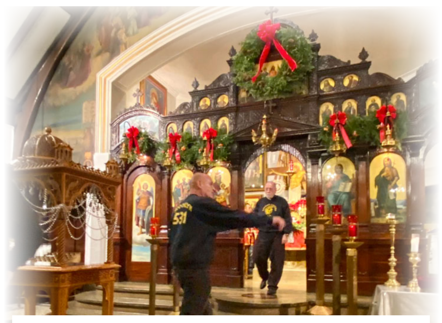
The "GOLDEN GREEKS" Boy Scout Troop #531 with their scoutmasters decorated the church proper for the holiday season. Pictured here are many of the young lads offering service to the Lord by admiring the 'BEAUTY OF HIS HOUSE'