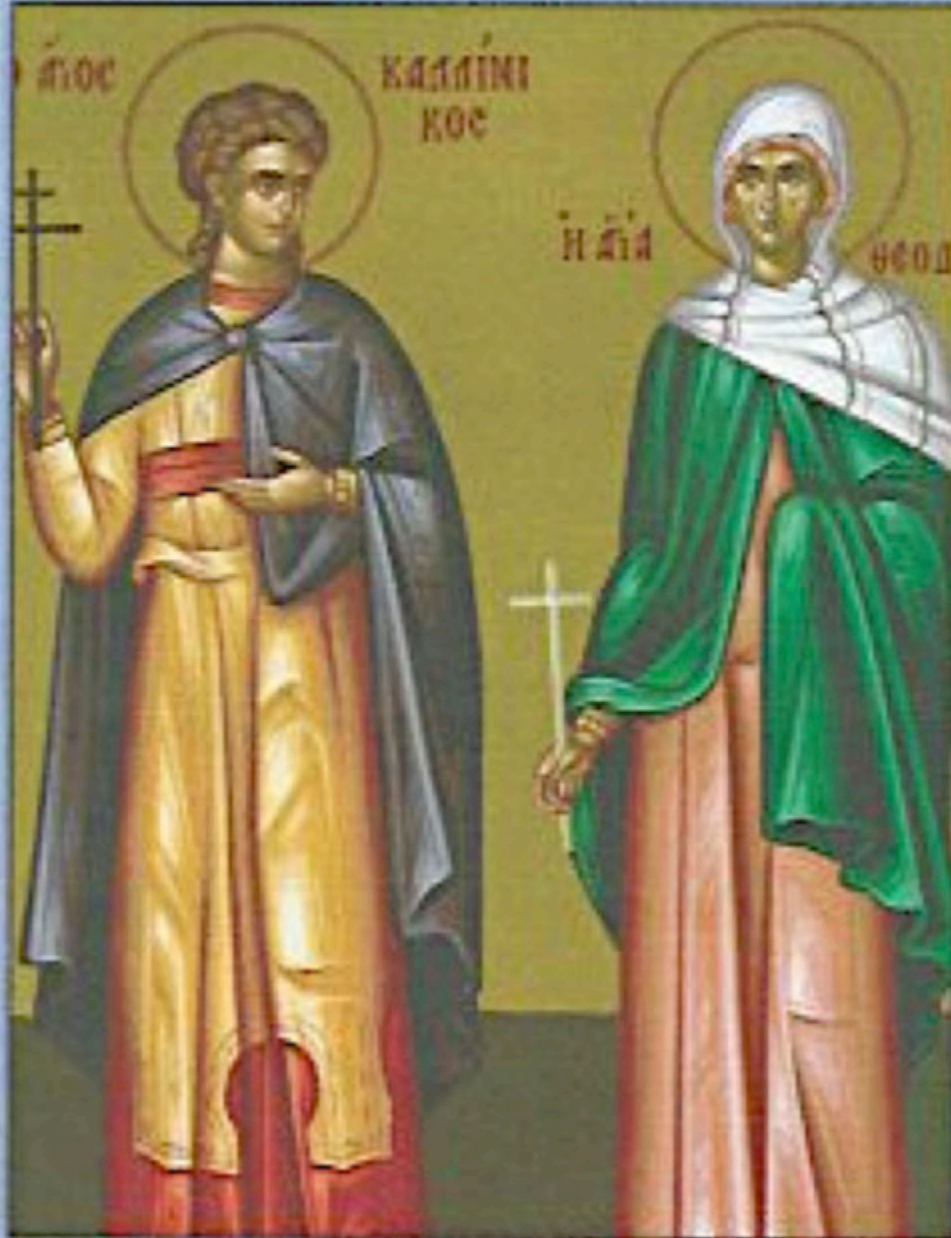
Icon of Saints Callistus and Theodotus — July 29th