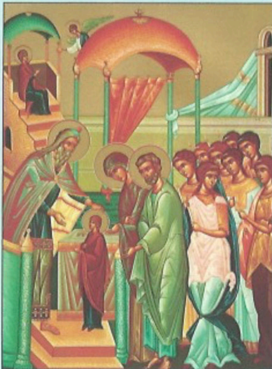
Icon of the Entrance of the Mother of God into the Temple -- November 21st

TWENTY-FOURTH SUNDAY AFTER PENTECOST NINTH SUNDAY OF LUKE