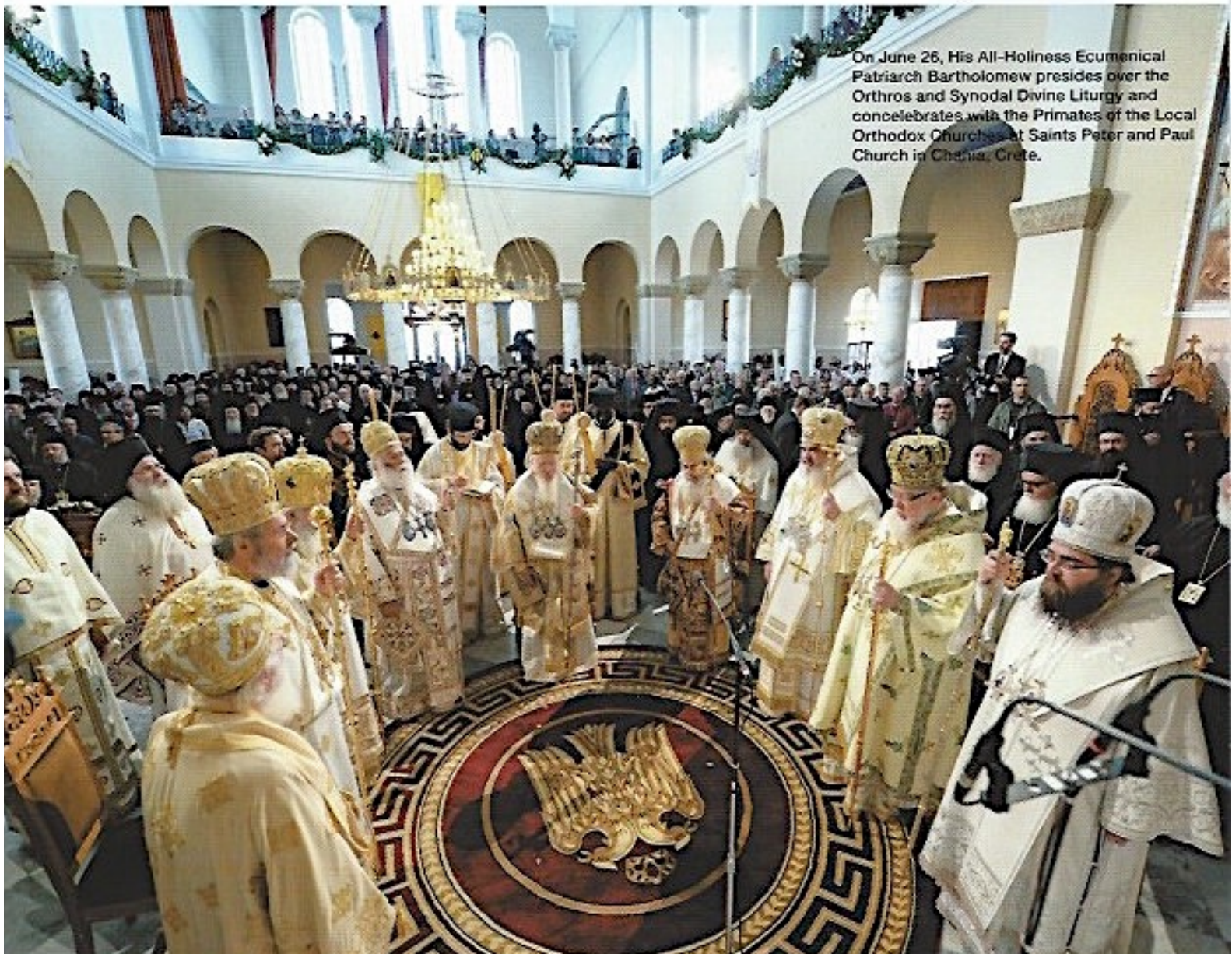
On June 26, His All-Holiness Ecumenical Patriarch Bartholomew presides over the Orthros and Synodal Divine Liturgy and concelebrates with the Primate of the Local Orthodox Church at Saints Peter and Paul Church in Chania, Crete.